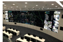
Salas de Controle