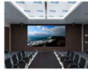
Salas de Reunião e Conferência